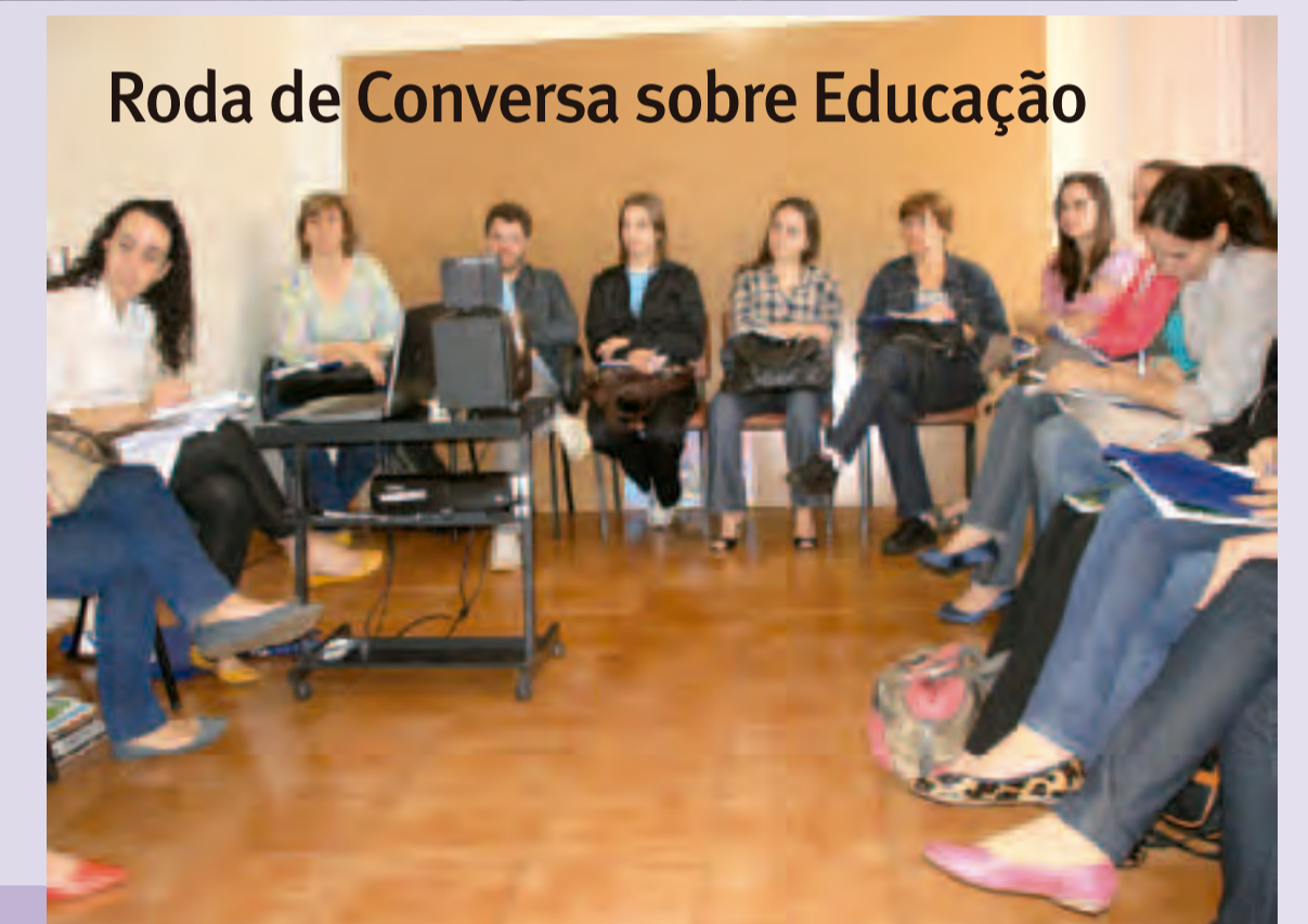
Roda de Conversa sobre Educação

Para cumprir o papel de fiscalizar e orientar os(as) psicólogos(as) e a comunidade, no ano de 2011, a composição da Subsede foi de: