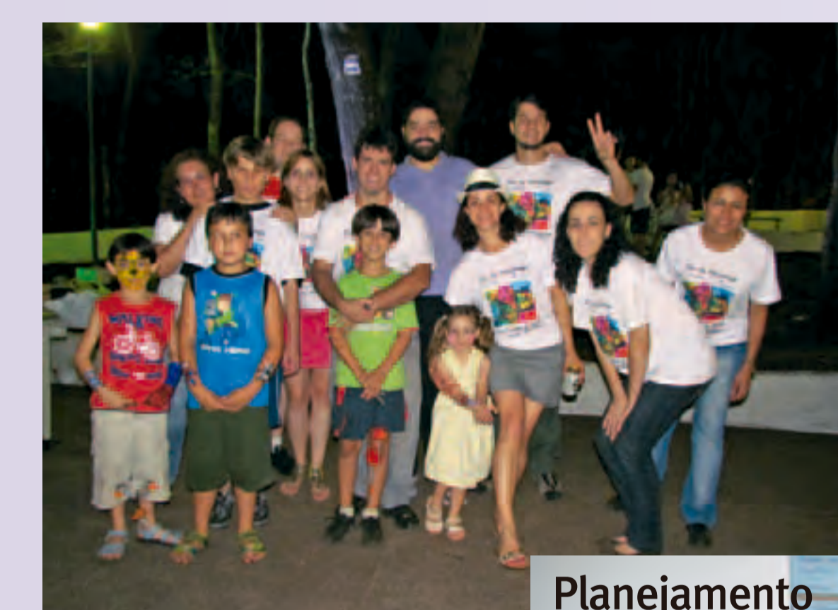
Dia do(a) Psicólogo(a) 2011 em Ribeirão Preto