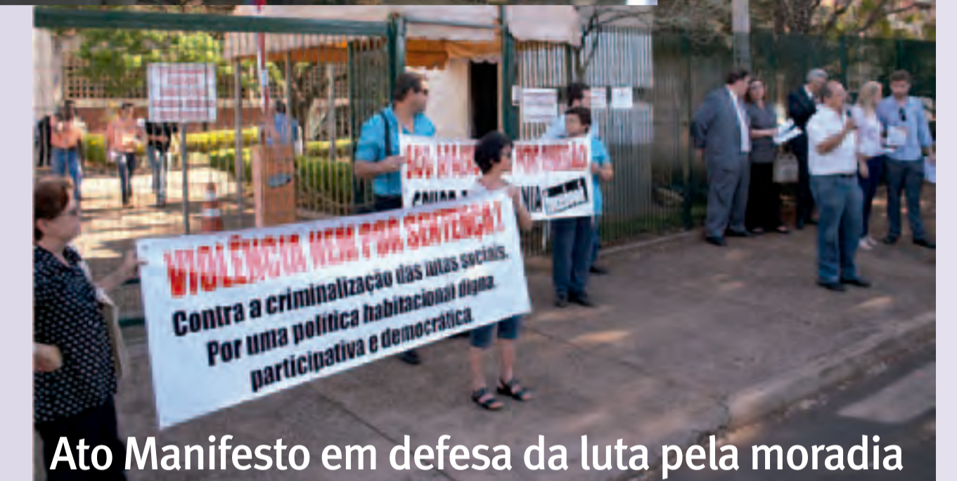
Ato Manifesto em defesa da luta pela moradia