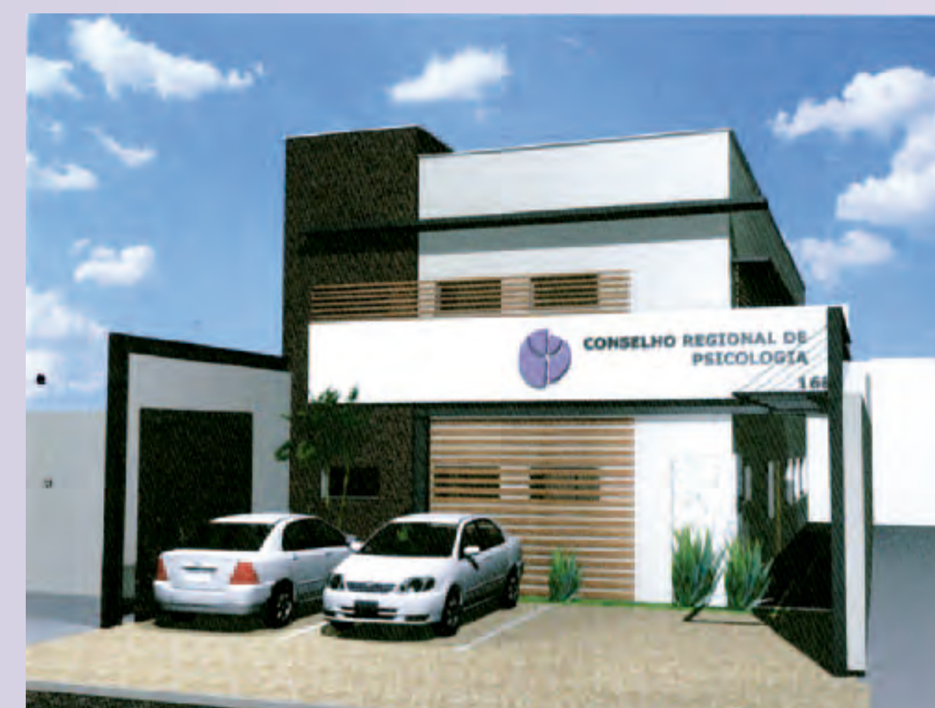
Projeção da nova Subsede reformada