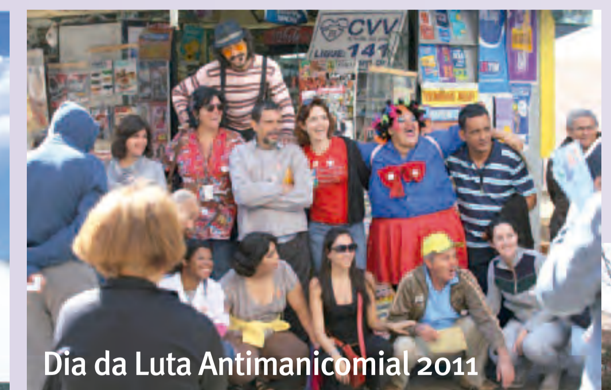
Dia da Luta Antimanicomial 2011