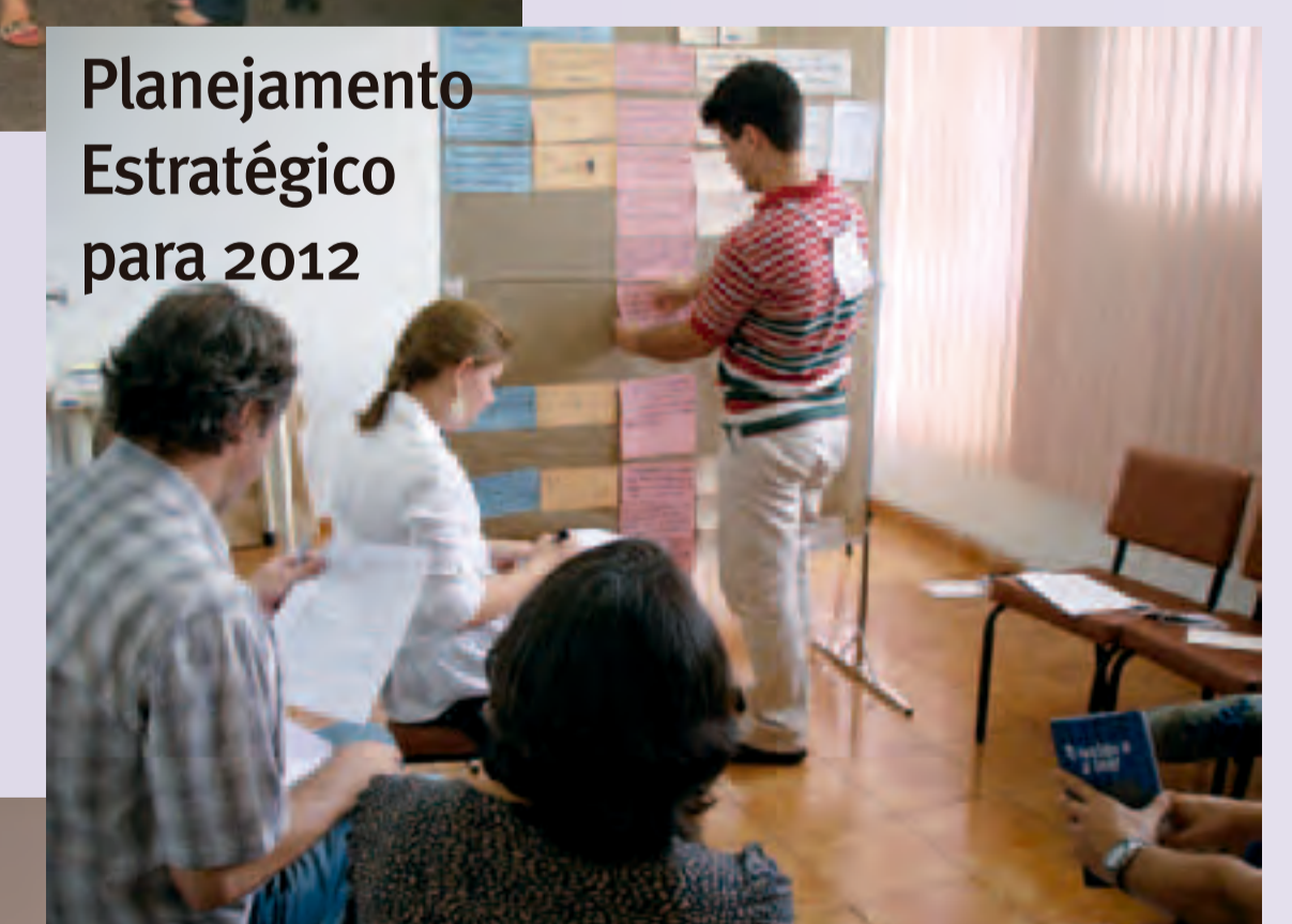
Planejamento Estratégico para 2012