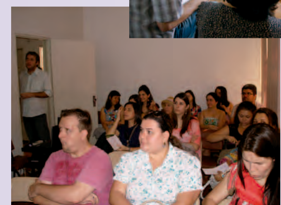
Fórum de Acolhimento Assistência Social