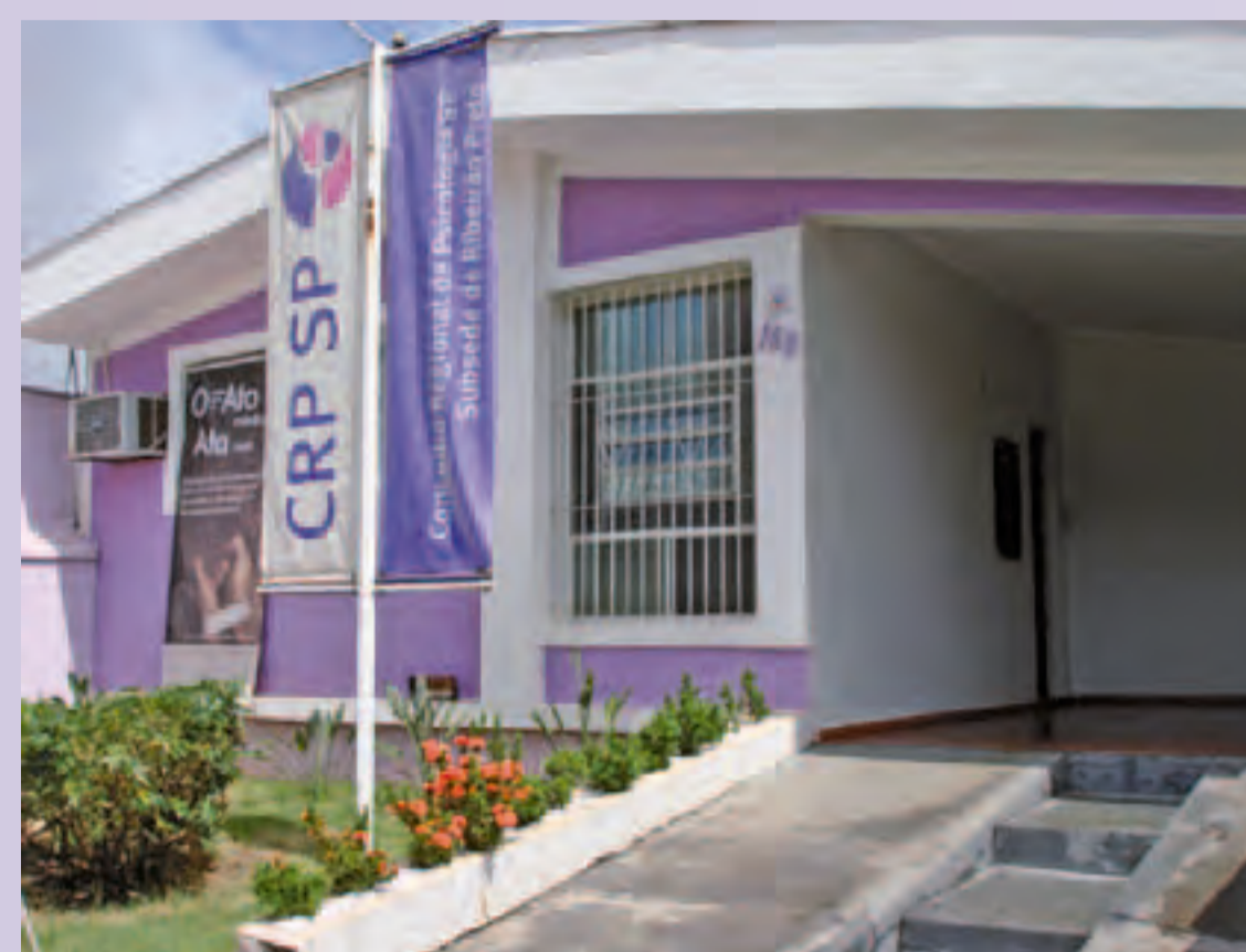
Fachada atual da Subsede