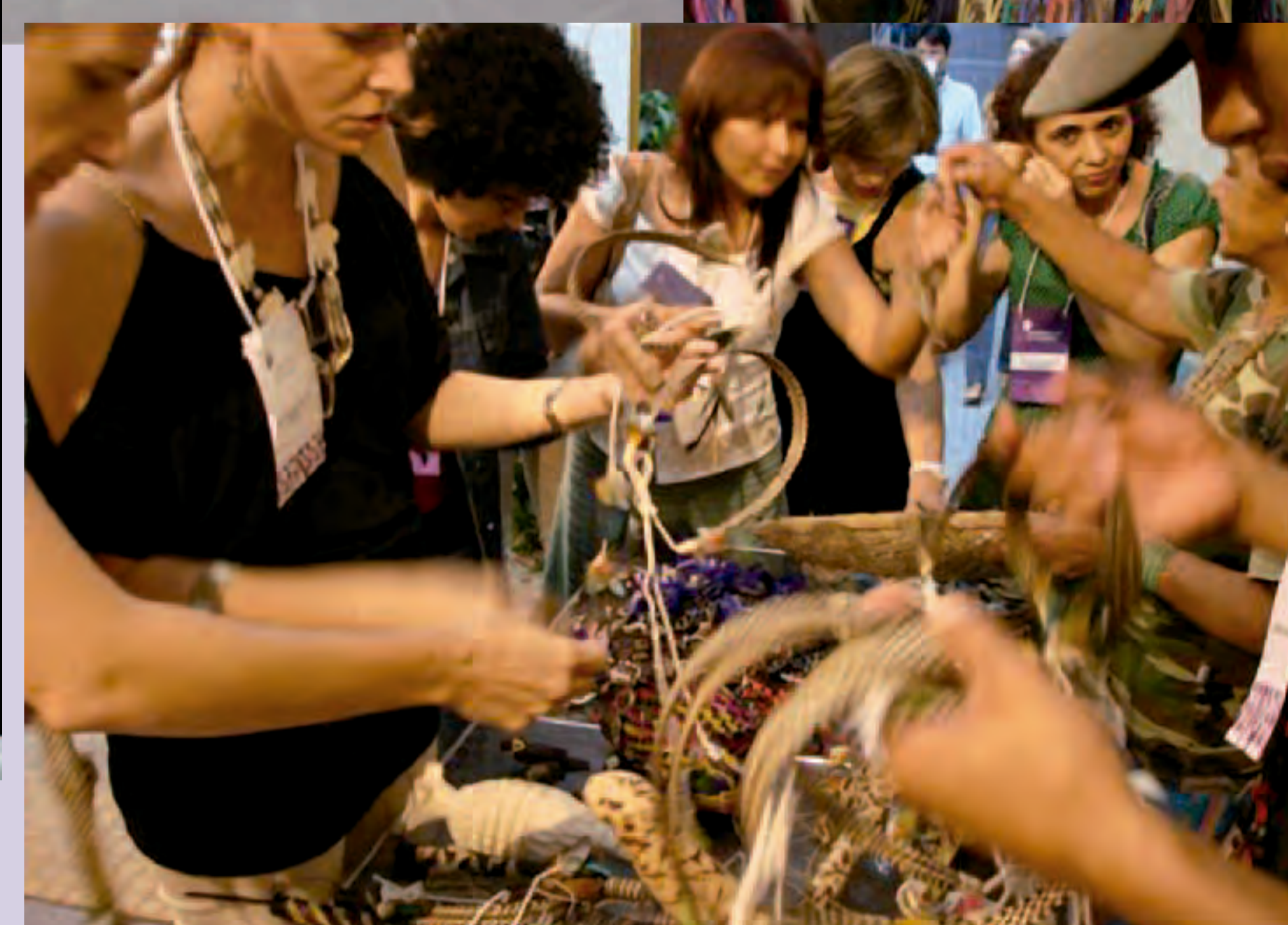
Feira de objetos tradicionais das culturas Guarani (SP) e Kadiwéu (MS)